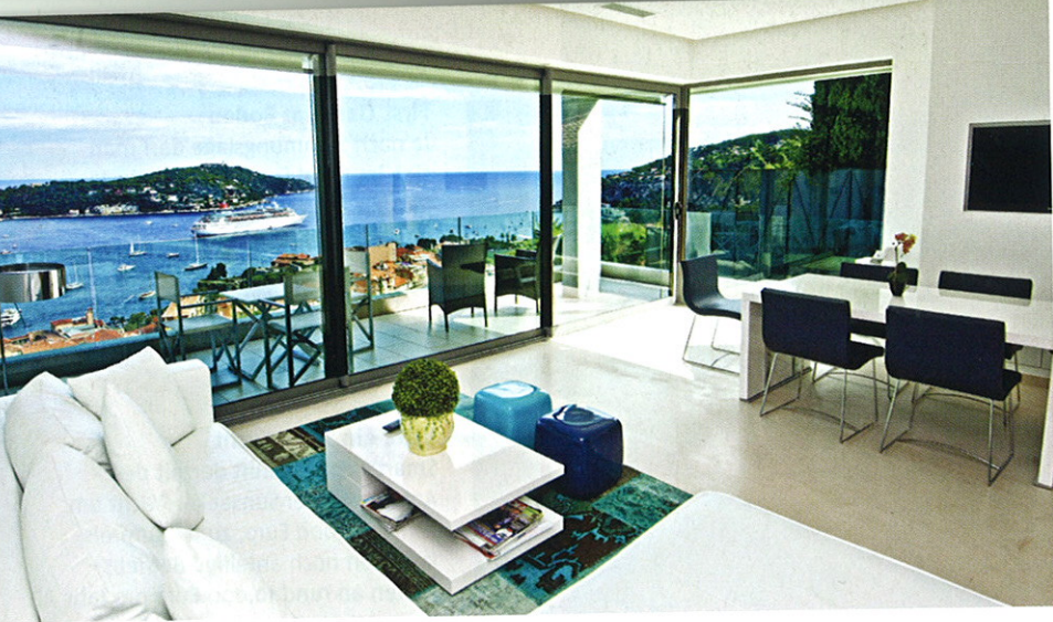
Villa Hippocampo, Villefranche-sur-Mer, Côte d'Azur Oberhalb einer kleinen Ortschaft nahe Nizza liegt diese Villa mit vier Schlafzimmern – atemberaubender Blick aufs Mittelmeer sowie Infinity-Pool sind inkludiert. Buchbar nur für Clubmitglieder. 3rdhome.com