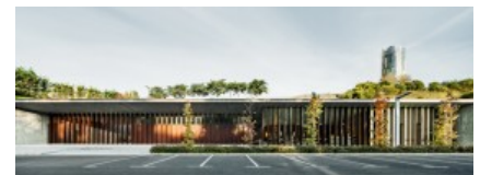
Batlle i Roig Arquitectes > Tanatori San...