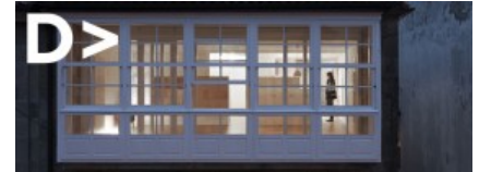
Concheiro de Montard > Casas Reais