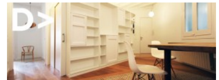
Laura Bonell > Reforma de un piso en c/...