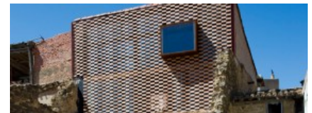
Blur arquitectura > Casa Rural, San Vice...